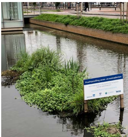
Proefopstelling met waterplanten in Delft.

De directeurs van het consortium vormen een stuurgroep aan opdrachtnemerskant. Zij maakten zich in het begin zorgen of De Groene Motor voldoende zou opleveren voor de KRW.