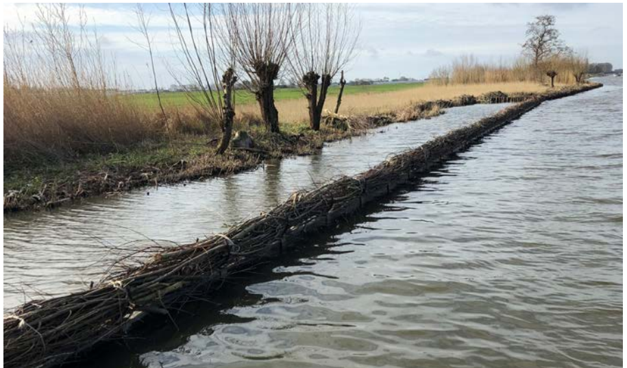
Woudse Polder met rijshouten vooroever.

Het hoogheemraadschap vertrouwde op de expertise van de inschrijvende bureaus